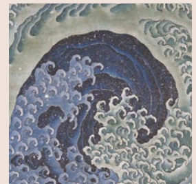
上町祭屋台天井絵「女浪」 一般財団法人北斎館