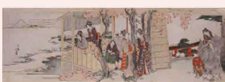
葛飾北斎「神田明神休茶屋」(前期)