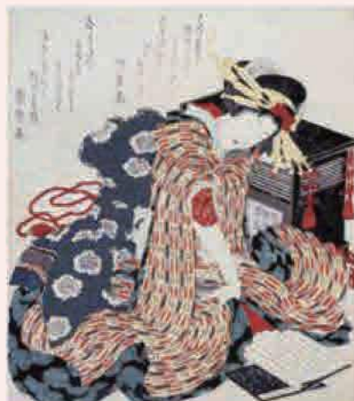
葛飾北斎「枕草子を読む娘」(前期)