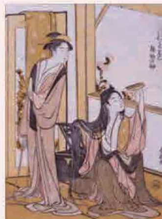
葛飾北斎「俳諧おた巻 植物の部」(前期)