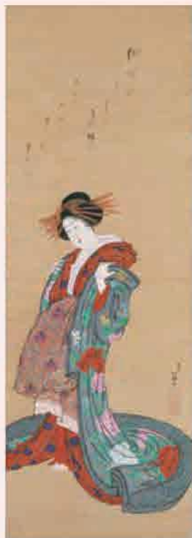
葛飾北斎「花魁」(後期)