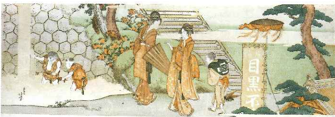
葛飾北斎「目黒不動尊詣」(前期)