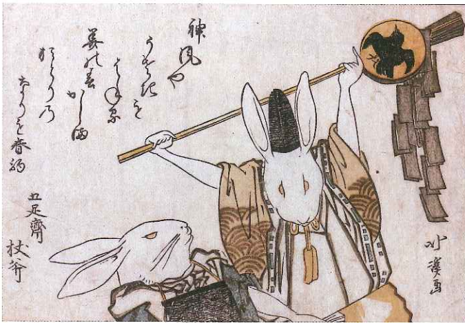
魚屋北溪「兎の鹿島おどり」(後期)