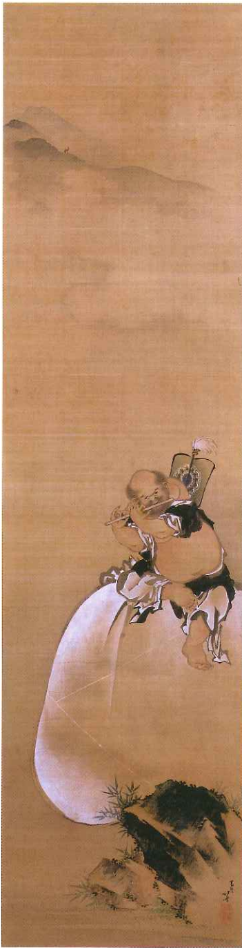
葛飾北斎「布袋図」(前期)