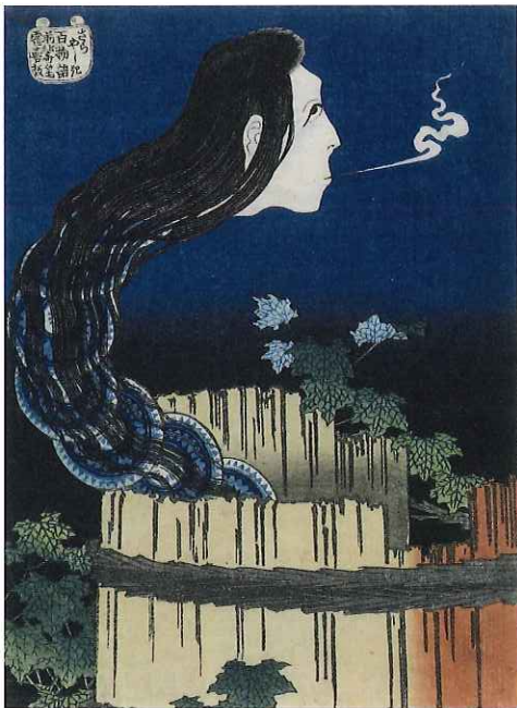
葛飾北斎『百物語 さらやしき』(後期) Okiku's Ghost at the Plate Mansion, from the series One Hundred Ghost Stories