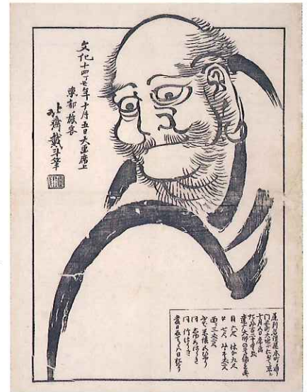
葛飾北斎『北斎大画即書引札』名古屋博物館(前期) Promotional Handbill for Hokusai's Performance of Painting a Huge Portrait of the Bodhidharma