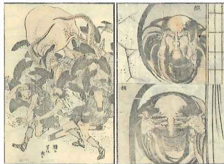
葛飾北斎『北斎漫画』十二編 Sketches by Hokusai, vol.12