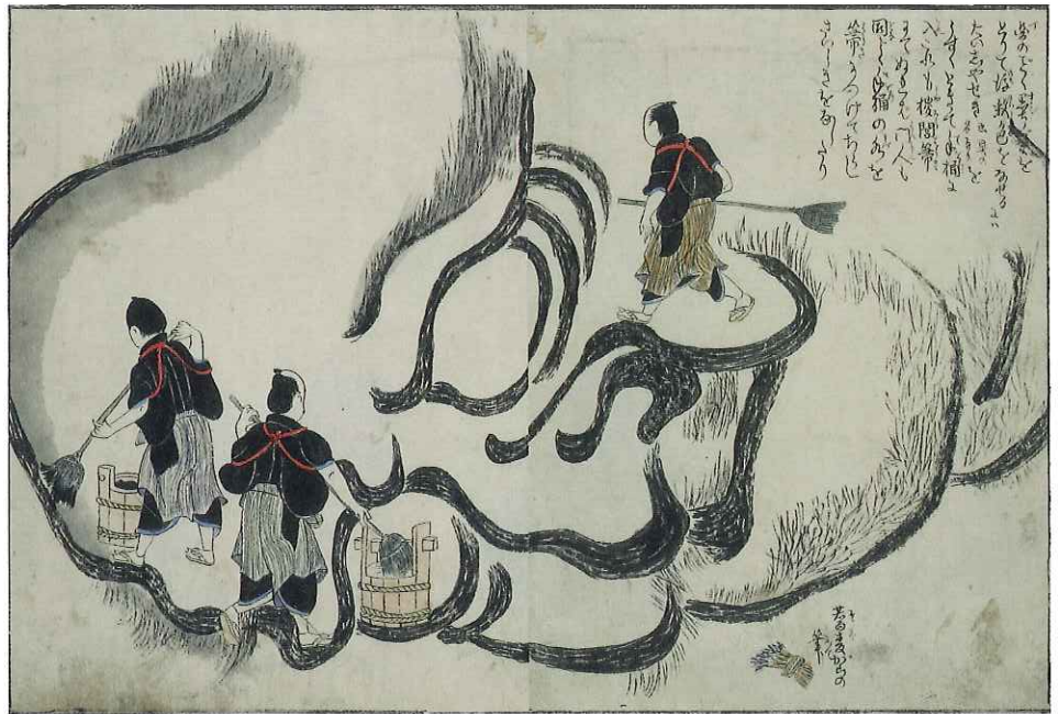
高力猿猴庵『北斎大画即書』名古屋博物館(後期) Details of Hokusai's Performance of Painting a Huge Portrait of the Bodhidharma