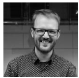
ジェローム・ブシャール Jérôme Bouchard [カナダ | Canada] ペインティング、インスタレーション Painting, Installation