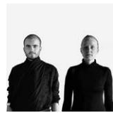
METASITU METASITU [ギリシャ | Greece] [ウクライナ | Ukraine] ビデオ、インスタレーション Video, Installation