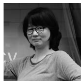
イ・スヨン Lee Sooyoung [韓国 | Korea] パフォーマンス、インスタレーション Performance, Installation