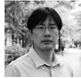
ホ・テウオン Heo Taewon [韓国 | Korea] ペインティング、インスタレーション Painting, Installation