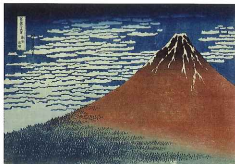
富嶽三十六景 凱風快晴 A Mild Breeze on a Fine Day, from the series Thirty-six Views of Mount Fuji