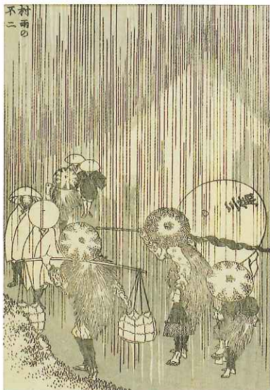
村雨の不二 『富嶽百景』三編より【Ⅲ期展示】 Fuji in a Passing Shower, from One Hundred Views of Mount Fuji; volume 3