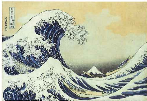
富嶽三十六景 神奈川沖浪裏 Under the Wave off Kanagawa, from the series Thirty-six Views of Mount Fuji