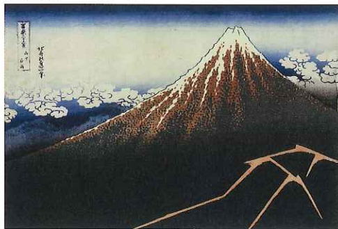
富嶽三十六景 山下白雨 Rainstorm Beneath the Summit, from the series Thirty-six Views of Mount Fuji